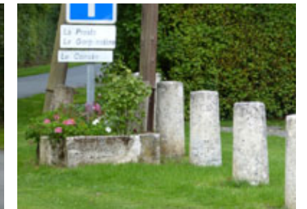
Exemple d'éléments regroupés