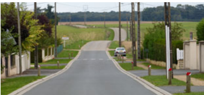
Lotissement après aménagement

Voici un exemple de traitement des espaces publics qui donne une image homogène du lotissement récent. Ce type d'aménagement donne l'impression que la route se fraye un passage au milieu de l'espace paysager, que les parcelles privatives se prolongent jusqu'à la rue. L'aménagement assure en priorité le confort et la sécurité des riverains.