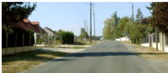
Lotissement avant aménagement paysager